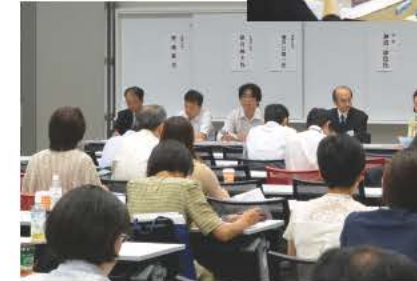
2013年度全国研究会 明治大学