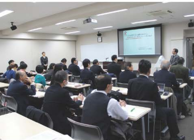
西日本部会 立命館西園寺記念館 (2014年12月16日)