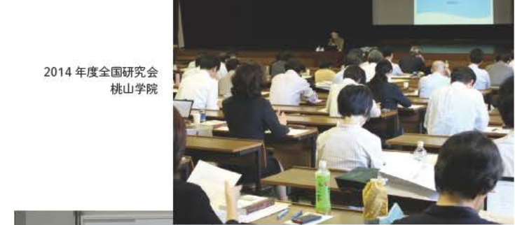
2014年度全国研究会 桃山学院