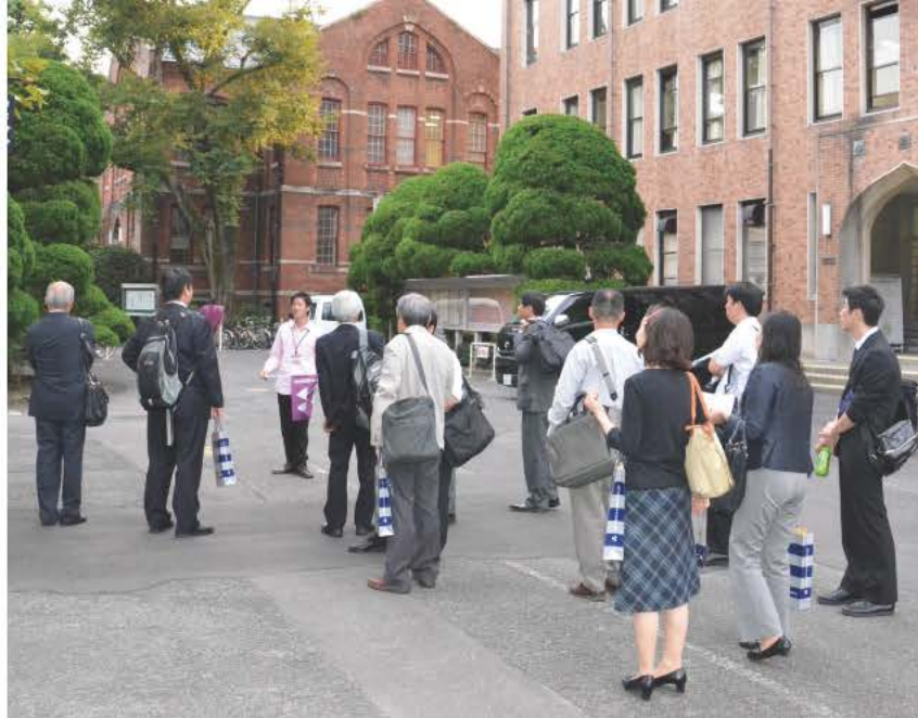
2012年度全国研究会 同志社大学

全国大学史資料協会には 東日本部会と西日本部会があります。 年1回の総会、全国研究会のほか、 各部会で研究会を開催しています。 講演や見学などを通して、 大学史編纂・資料保存・展示・ 自校史教育等の充実に寄与しています。