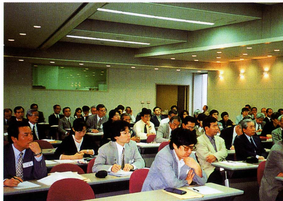
1996年10月 設立記念総会 (広島大学附属中央図書館)

The regional groups will hold a joint general meeting once a year to present the results of their research.