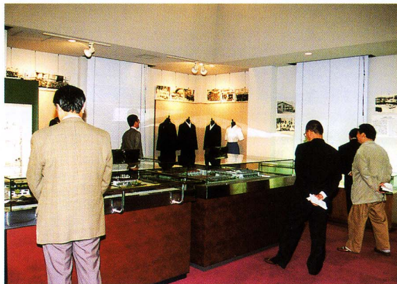
1996年10月 全国研究会 (広島女学院歴史資料館)

To learn about how documents are preserved and used, tours of related facilities will be organized.