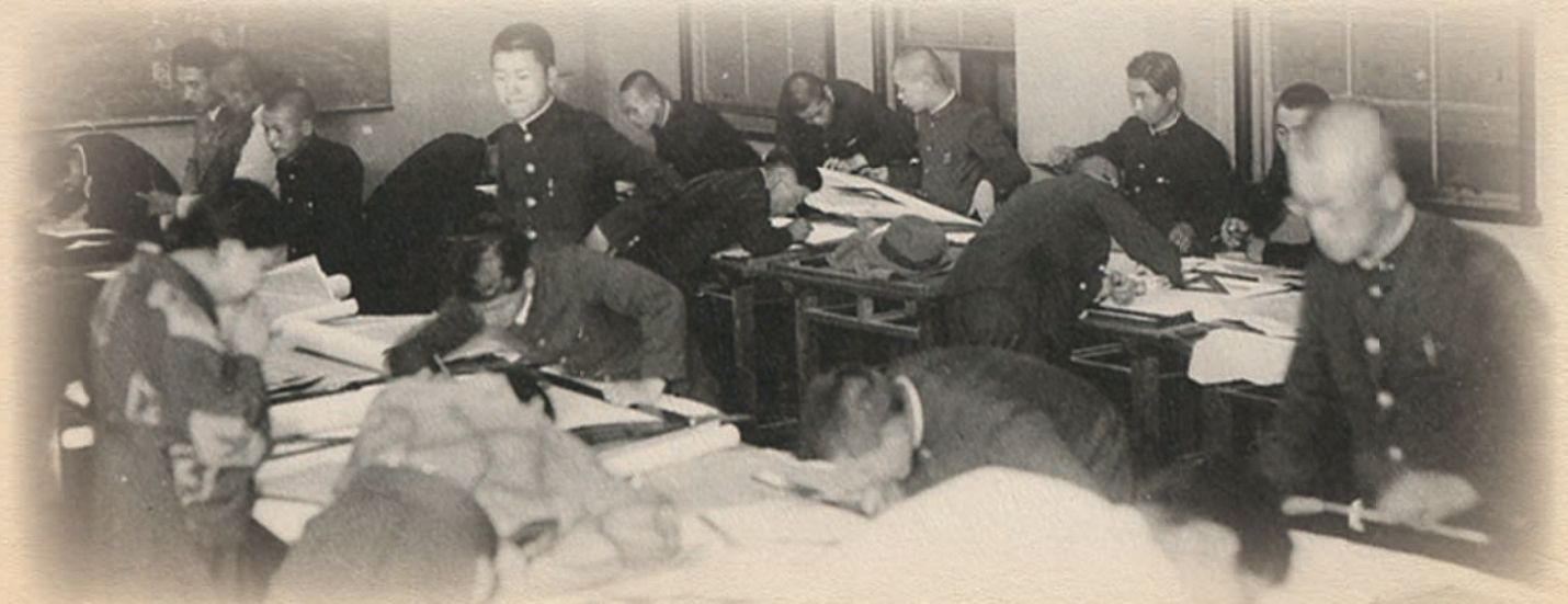
「授業風景(早稲田工手学校建築科)」(1938年)

会 期：2022年4月23日(土)～6月5日(日) 会 場：早稲田大学歴史館 企画展示室 主 催：早稲田大学歴史館(旧：大学史資料センター)