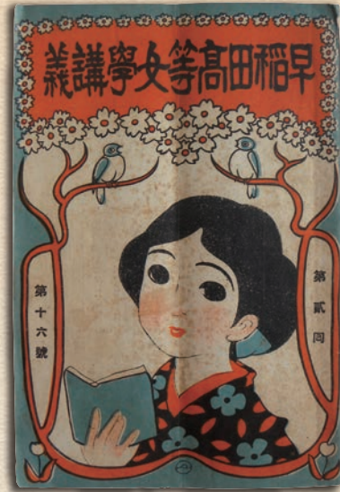
「早稲田高等女学講義」(1923年)

今から約100年前の1921年、早稲田大学は初めて女子の聴講生を受け入れました。その頃は男女で教育制度が異なり、女子に門戸を開く大学はごく少数であった時代でした。1939年には、女子を学部の正規学生として受け入れ、今日に至るまで多数の卒業生を輩出してきました。