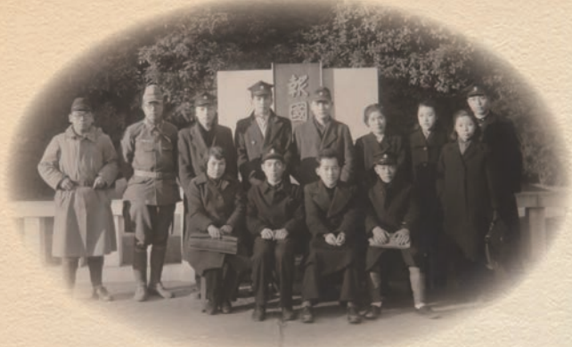
「数少ない国文の友を戦争に送る会」(1944年)